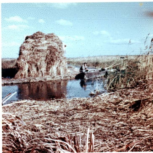
Gran garbera de canyet preparada per al seu transport en barquet a sa Roca per a la transformació en pasta de paper,.

Dels feixos es feien garbes i de les garbes, garberes molt grans que eren transportades principalment en barquet cap al fort i d’allà en carros fins els camps on havien de servir per a fer formiguers. Es segava amb la falcella i un cop conformades les garbes es posaven dins el barquet que era conduït pel barquer amb la crossa pels distints canals o siquions. Si el malacó era net i fort, els segadors s’estimaven més estirar la barca des d’ambdós costats amb cordes.