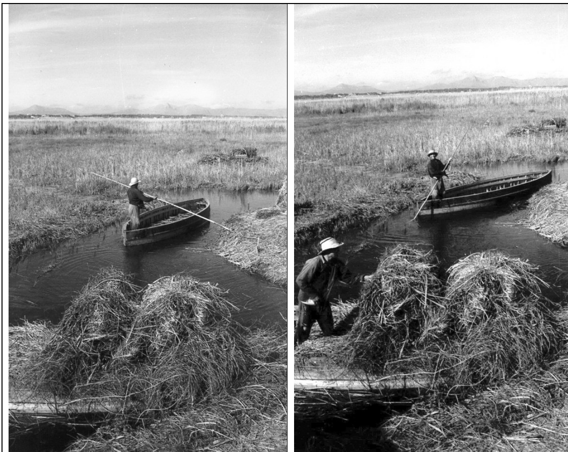
Segadors de s'Albufera en plena tasca de carregar el bagatge (bàsicament sesquera) en els barquets. Fotografia: J. Mascaró Pasarius. Del llibre MARGINALIA, Marjals de Huyalfas (Sa Pobla) de Josep Obrador Socies. Sa Pobla, 1987.

Del transport del bagatge, en tenim també dos testimonis gràfics immortalitzats per Josep Mascaró Pasarius probablement els anys cinquanta.