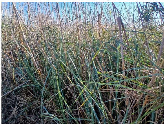
Sesquera prop del Lliser de ses Pardes

La sesquera, planta perenne i robusta de la família de les junces, creix molt densa i atapeïda a una gran part de s'Albufera, principalment en el sector comprès entre el Canal d'en Pujol i la Síquia dels Polls, és a dir, es Rotlos, es Rotlets, Son Carbonell, ses Motes, i fins el canal d'en Palet. Pot arribar a assolir una alçada de prop de tres metres; allà on creix forma una massa infranquejable a la qual contribueixen les terribles fulles amb els seus tres caires serrats de tall esmolat.