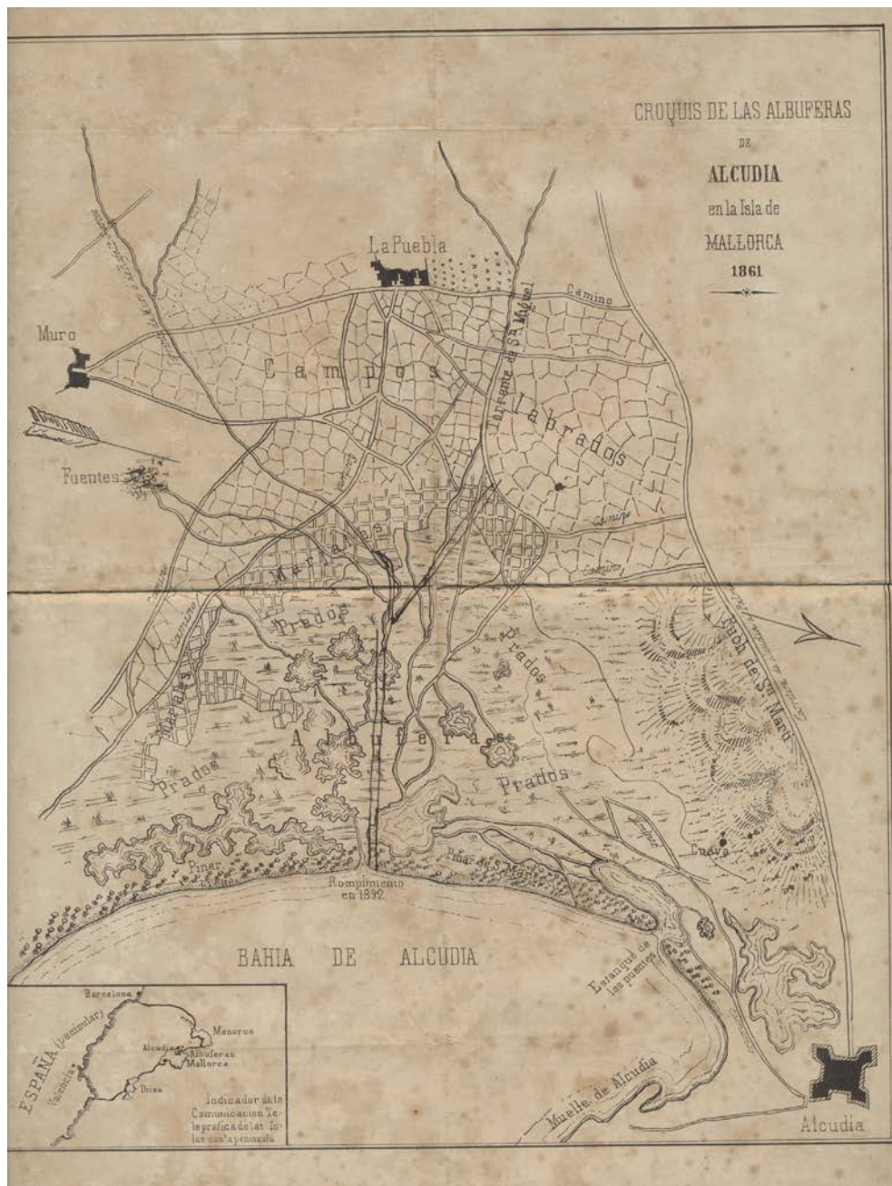
Plànol de s'Albufera de 1861